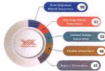
Şekil C.1-4 İstihdam edilen uluslararası doktora öğretim elemanı sayısının en yüksek olduğu üniversiteler