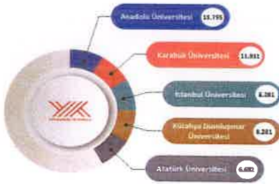
Şekil C.2-4 Öğrenim gören uluslararası öğrenci sayısının en yüksek olduğu üniversiteler

Karabük Üniversitesi uluslararası öğrenciler için çekim merkezi olma yolunda önemli bir ilerleme kaydetmiştir. YÖK "Üniversite İzleme ve Değerlendirme Genel Raporu-2024'e göre Karabük Üniversitesi, uluslararası öğrenci oranının en yüksek olduğu üniversiteler, uluslararası öğrenci sayısının en yüksek olduğu üniversiteler, uluslararası değişim programlarına katılan öğretim elemanı sayısının en yüksek olduğu üniversiteler arasında ilk sıralardadır.